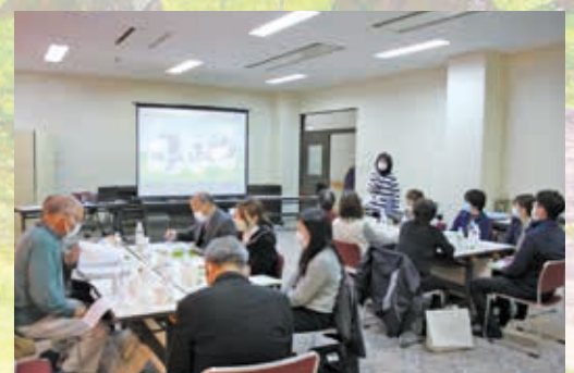
生活支援体制整備事業 「地域ささえあい協議体」