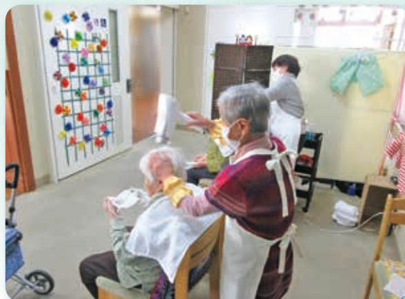
がんばる会ボランティア