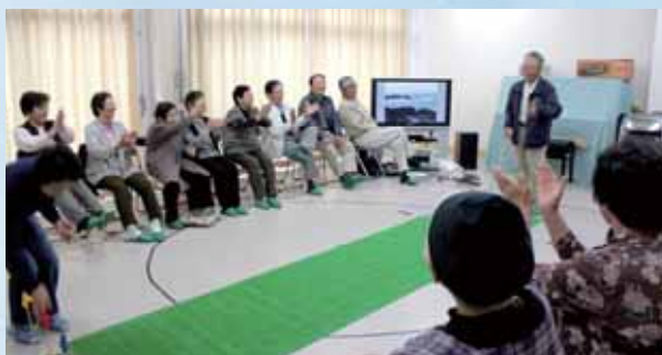
9区いきいき・サロン