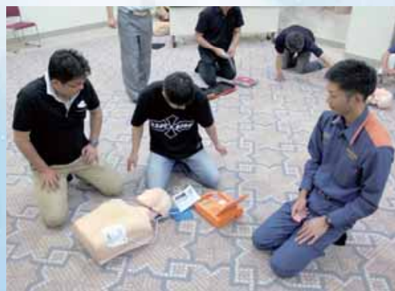
防災ボランティアAED講習会