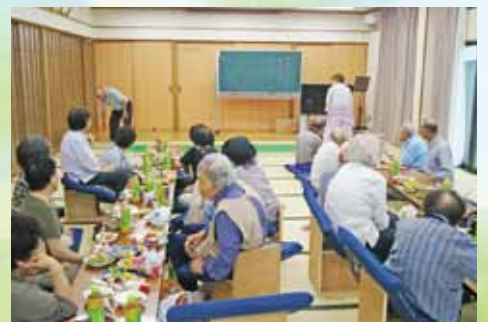
16区 いきいき・サロン