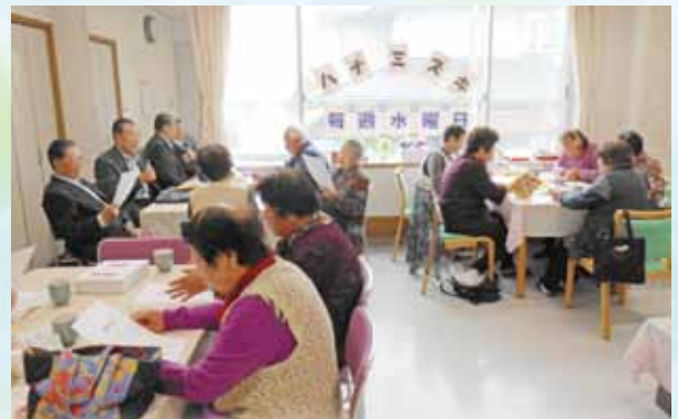
コミュニティサロン「ハナミズキ」