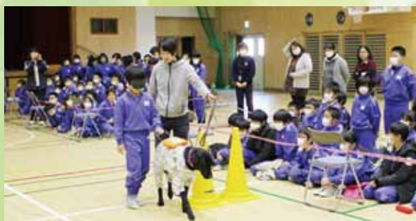
福祉教育「盲導犬ふれあい教室」