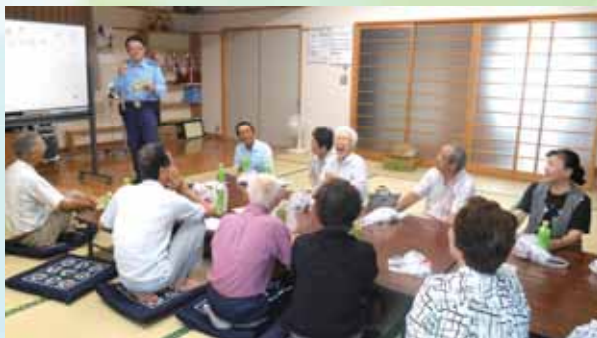
17区いきいき・サロン