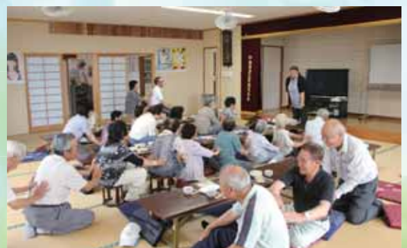
1区いきいき・サロン