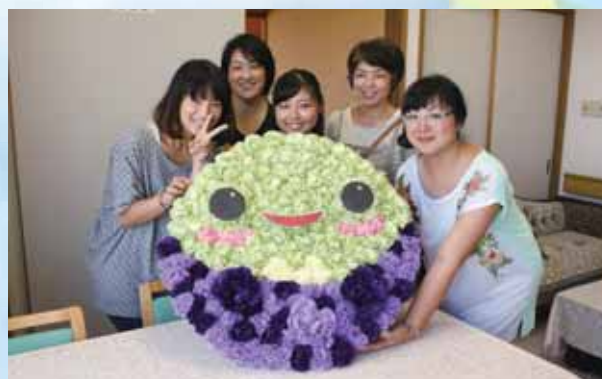
ママボランティア 「ほっこりん」