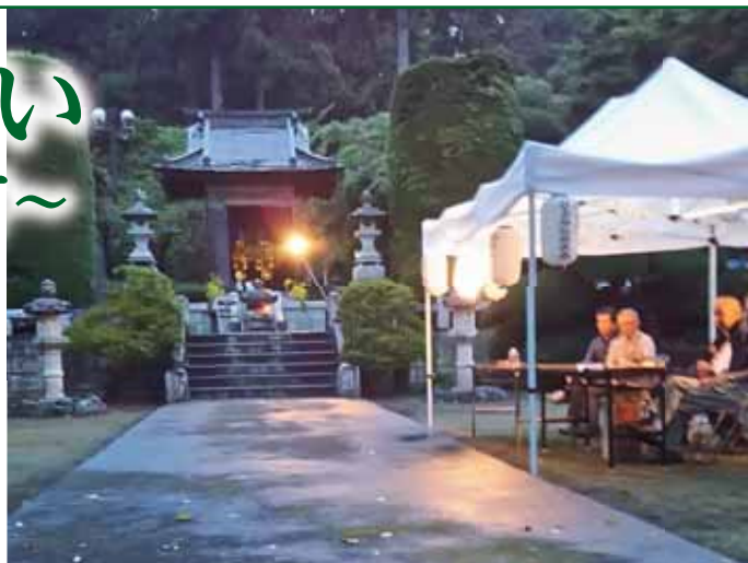
榛東村英霊廟(柳澤寺)

また、この日は柳澤寺の縁日も行われており、夜の英霊廟に遺族の方々が御霊に手を合わせておられました。