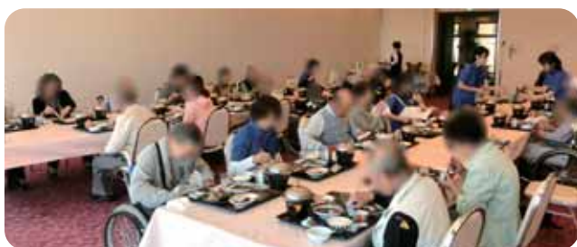
介護保険外出事業