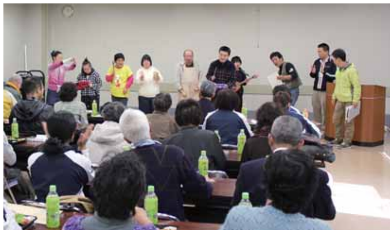
南相馬市「えんどう豆」

南相馬市では福祉作業所「えんどう豆」の利用者の方々が震災時音楽に助けられたことの想いを曲にした演奏や踊りを披露してくださり心が和むひとときでした。