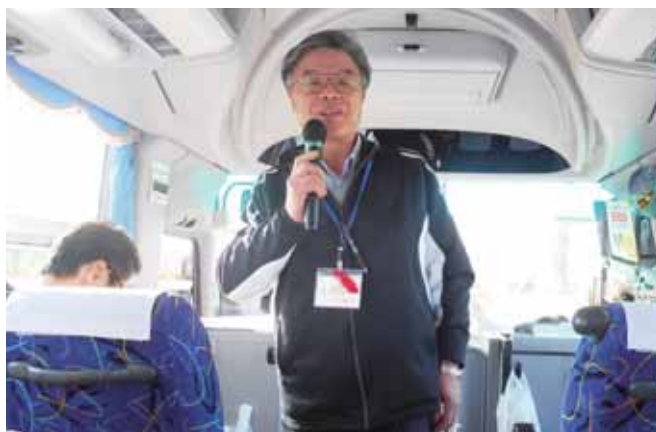
新地町社協元災害ボランティアセンター長

また、新地では町内をまわりながら説明を受け、80%以上被災住宅が復旧し生活している様子など復興計画が進んでいる話が聞け、参加者も少しほっとしている表情でした。