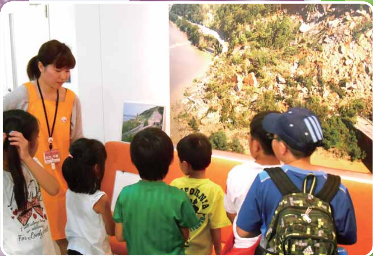
親子防災体験教室：おぢや震災ミュージアムそなえ館